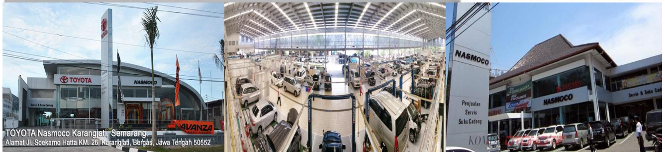
Sumber: Perseroan, November 2016

Peta dibawah ini menggambarkan jaringan grup pembiayaan Perseroan secara geografis per November 2016: